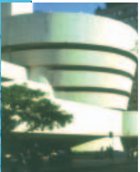
...in Museen, Archiven, Bibliotheken, Galerien...