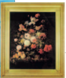
...schützen und erhalten.